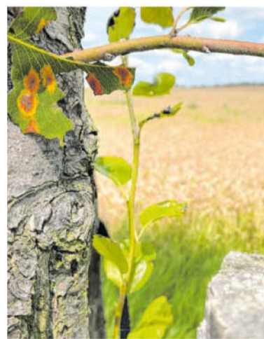
Die Birnenbäume der Allee sind auch mit dem Birnengitterrost-Pilz befallen.

Eine Eigenschaft der Allee, die zu Einschränkungen für die Bäume führt, ist nicht ohne Weiteres zu