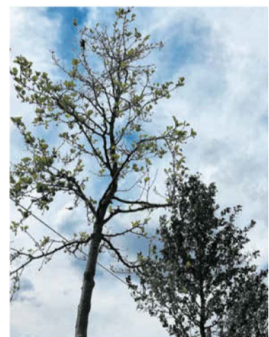
Im Frühjahr fraßen Raupen einige der Obstbäume kahl. Die meisten haben sich erholt.

Grund dafür sei auch, dass die Allee im Herbst des Jahres 2007 sehr schnell angelegt worden sei. „Der damalige Minister für Infrastruktur der Landesregierung, Reinhold Dellmann, hat sich auf unsere Initiative hin für die Allee